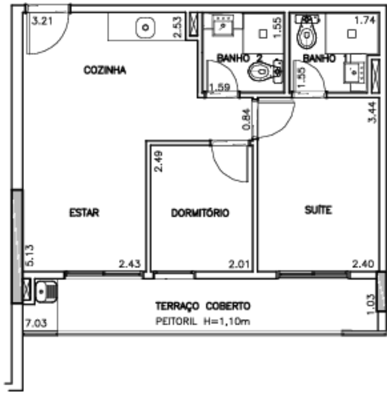
12º PAVIMENTO - PLANTA APARTAMENTO FINAL 4 (OPÇÃO 1) ÁREA TOTAL PRIVATIVA: 47,73m²

NOTAS: -FORMATO E DIMENSÕES DAS LOUÇAS SANITÁRIAS, CUBAS E BANCADAS SÃO APENAS REFERÊNCIA, PODENDO SOFRER ALTERAÇÕES EM FUNÇÃO DO MEMORIAL DESCRITIVO. -CONFORME CLAUSULA CONTRATUAL, SÃO TOLERÁVEIS DIFERENÇAS DE ATÉ 02% NAS METRAGENS QUE RESULTEM DA EXECUÇÃO DA OBRA. - AS COTAS SÃO MEDIDAS DE FACE A FACE DAS PAREDES. - AS MEDIDAS SÃO EM METRO. - ESSA PLANTA PODERÁ SOFRER AJUSTES DECORRENTES DA EXECUÇÃO E ELABORAÇÃO DOS PROJETOS EXECUTIVOS DE ESTRUTURA, ARQUITETURA E INSTALAÇÕES.